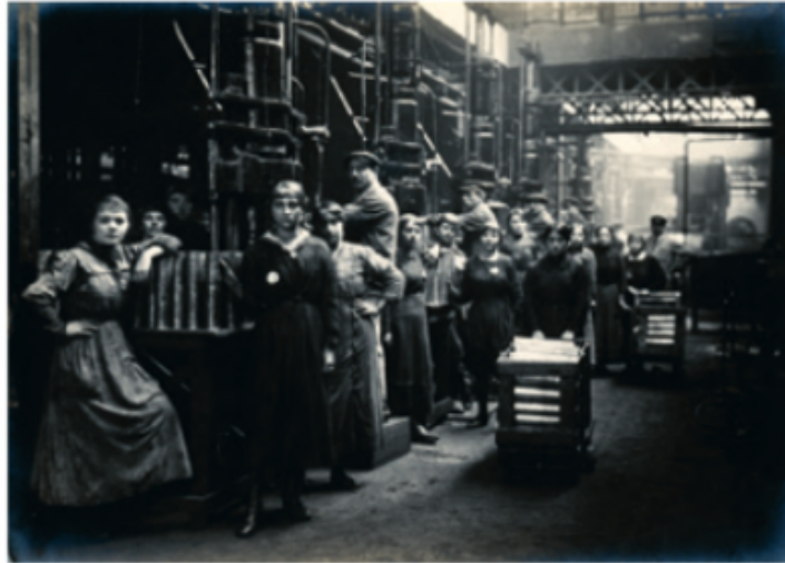
Femmes travaillant dans un atelier de sertissage de douilles de 75 de l'usine des Tréfileries et Laminoirs du Havre.