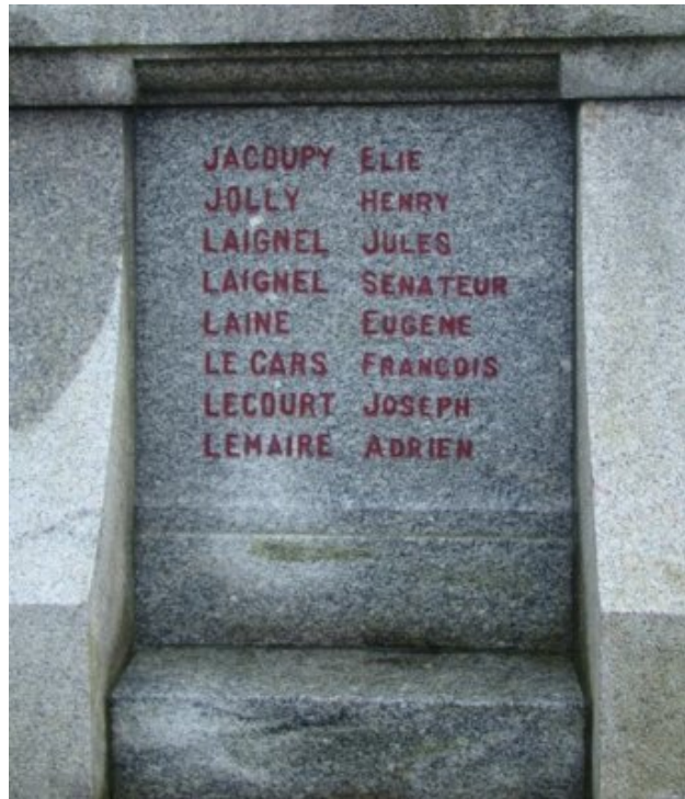
Monument aux Morts de Saint-Romain-de-Colbosc

Bien que l'acte de décès figure dans le registre de Saint-Pierre-de-Varengeville, son nom ne figure pas sur le monument aux morts de Saint-Pierre-de-Varengeville mais sur ceux de Saint-Romain-de-Colbosc et de Vitteflour.