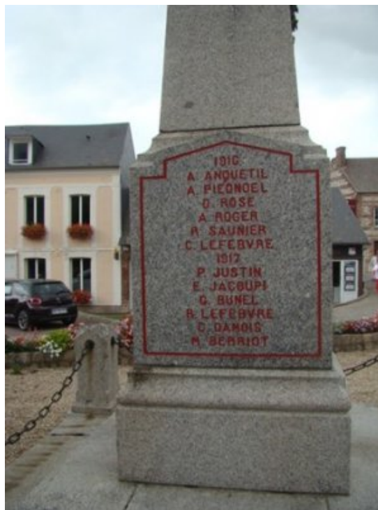
Monument aux Morts de Vitteflour