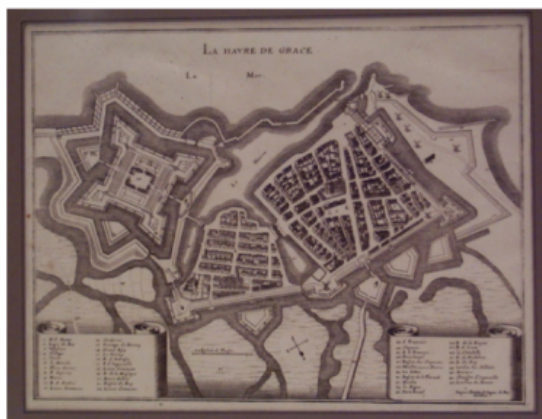
Plan du Havre et de sa forteresse au XVIIe Siècle