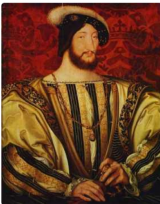
François 1er, par Jean CLOUET

Le 7 février 1517, François 1er ordonne la création d'un port fortifié au « lieu de Grasse », puis signe, le 8 octobre, de la même année, les chartes de fondation de la ville. Le Havre (Seine-Maritime)