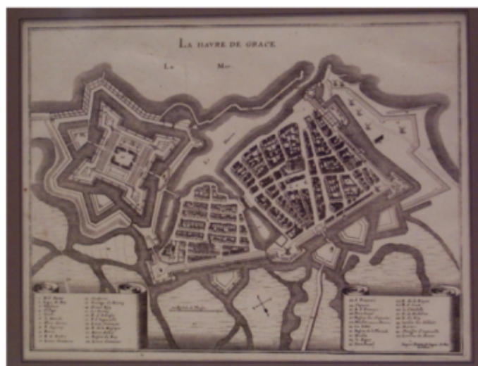
Plan du Havre et de sa forteresse au XVI e Siècle