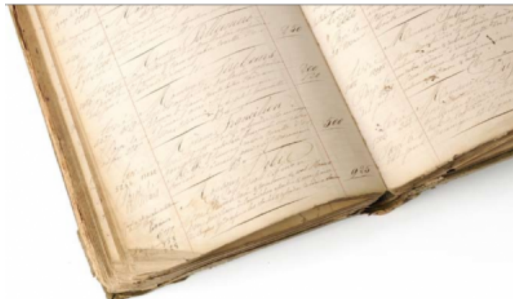
La collection du Musée L.Leroy

Le fond d'archives de la maison Leroy est principalement composé de recueils de ventes dans lesquels figurent la grande majorité des pièces livrées à nos clients depuis le début du XIXe siècle. Un compte rapide et non exhaustif permet d'estimer à près de 400 000 le nombre de pièces répertoriées dans nos registres et vendues pendant ces quelques 200 années d'activité ininterrompue.