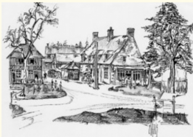
Le centre d'Ouille

Ouille groupe ses habitations autour de l'église romane de 1187, à l'ombre du château tenu par Guillaume d'Ouille. Les maisons sont à pans de bois et torchis, couvertes de chaume et se trouvent isolées les unes des autres. Elles forment ainsi les premières cours-masures le long de la Grand-rue, à proximité des mares et des champs à cultiver.