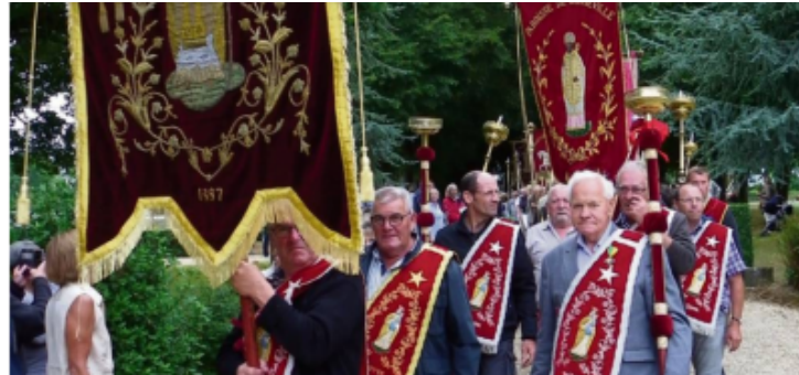
(Saint Aubin de Quillebeuf)

Dans l'Eure, il existe encore 117 confréries comprenant environ 1000 frères et soeurs. En 2015, à Yville sur Seine eut lieu le congrès régional. En 2019, plus de 800 charitons furent réunis à la basilique de Lisieux.