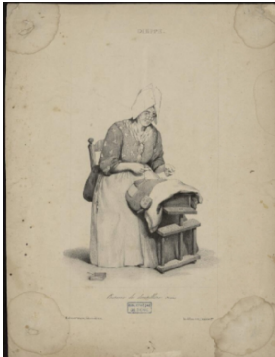
(dentellière dieppoise costume de 1835)

Implanté à Dieppe vers la fin du XVIème siècle, la dentelle ne se développe réellement qu'au début du XVIIème siècle. Le savoir-faire des dentellières est alors reconnue puisque Catherine De Rohan, duchesse de Longueville, désireuse d'ouvrir une école de dentelle dans son château d'Etrépagny, à Chantilly, fait venir des dentellières dieppoises comme maîtresses. A cette époque, un quart de la population de toutes classes et de tous âges, de six à soixante dix ans fait de la dentelle. On considère que c'est la seule occupation des femmes et des jeunes filles de marins pêcheurs et d'ouvriers.