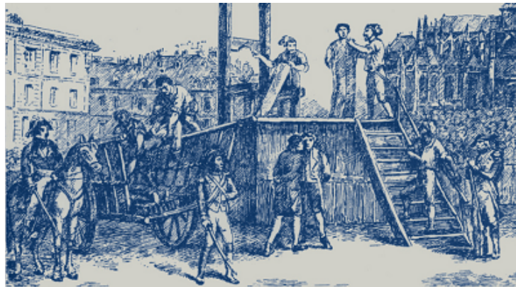
(Exécution de l'abbé Briche)

Il avait comme dicton : « il n'y a pas de plus grande preuve d'amour que de donner sa vie pour ceux qu'on aime. Et quand on la donne pour l'amour de Dieu, on atteint le plus haut degré de la perfection ».