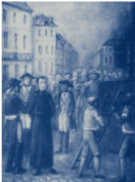
Avant de monter à la guillotine