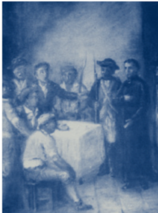
Le tribunal révolutionnaire