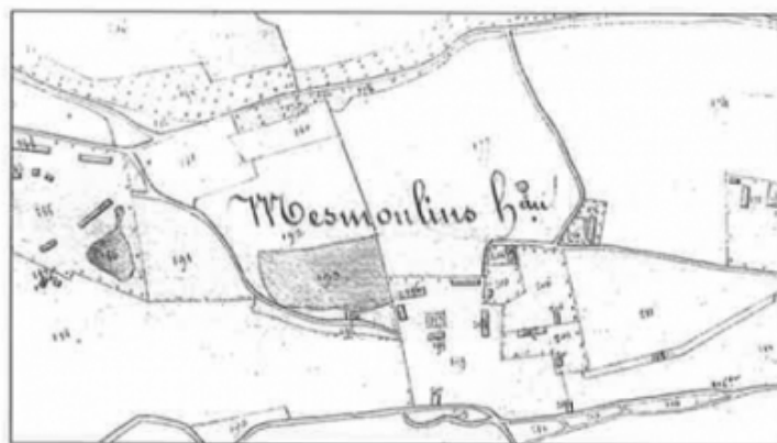
EXTRAIT DU PLAN DU CADASTRE DE LA SECTION DE MESMOULINS DRESSÉ EN 1823 Le numéro 203 désigne l'emplacement de l'ancienne église Saint-Pierre

http://tourvillelesifs.fr/histoire-et-patrimoine/Les%20mouvances%20de%20la%20m%C3%A9moire.pdf